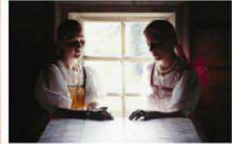
FEMMES ETERNELLES à travers le monde photographies d'OLIVIER MARTEL