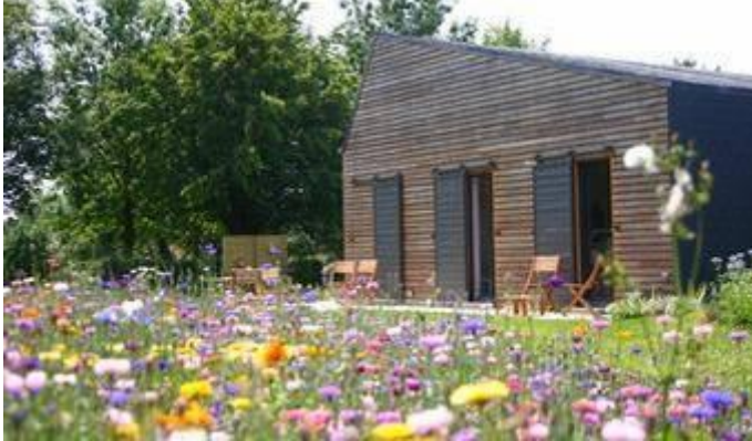
photo avec macaron