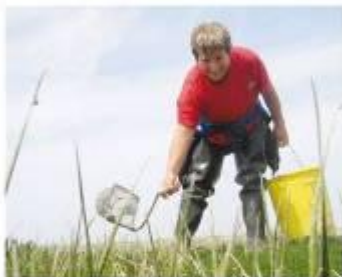
association des ramasseurs de salicornes