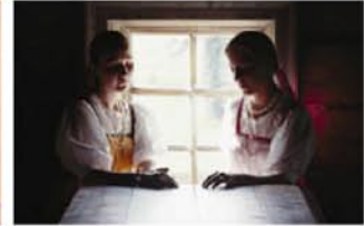
FEMMES ETERNELLES photographies à travers le monde d'OLIVIER MARTEL